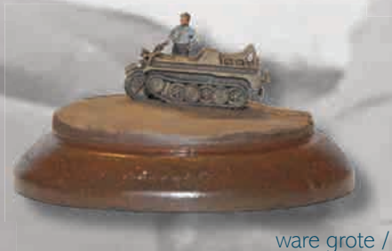
ware grote / taille réelle

La figurine est de Preiser qui est quasi la