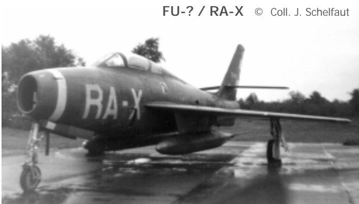
FU-? / RA-X

FU-149 op het einde van zijn loopbaan met het kenteken van het 31ste Smaldeel op de neus en de kleuren van de 3 smaldeelen van KB op het richtingsroer en de vleugeltips.