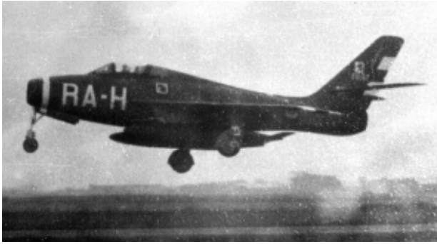
FU-67 / RA-H