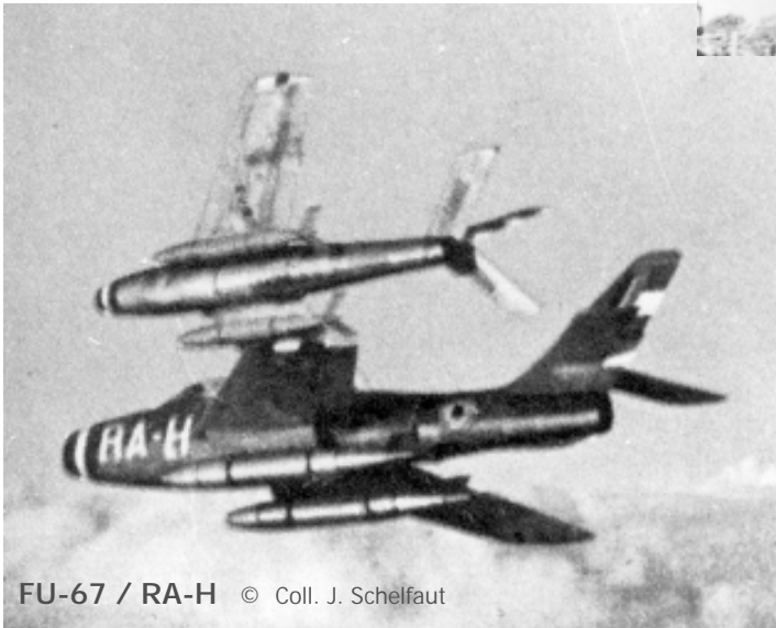
FU-67 / RA-H