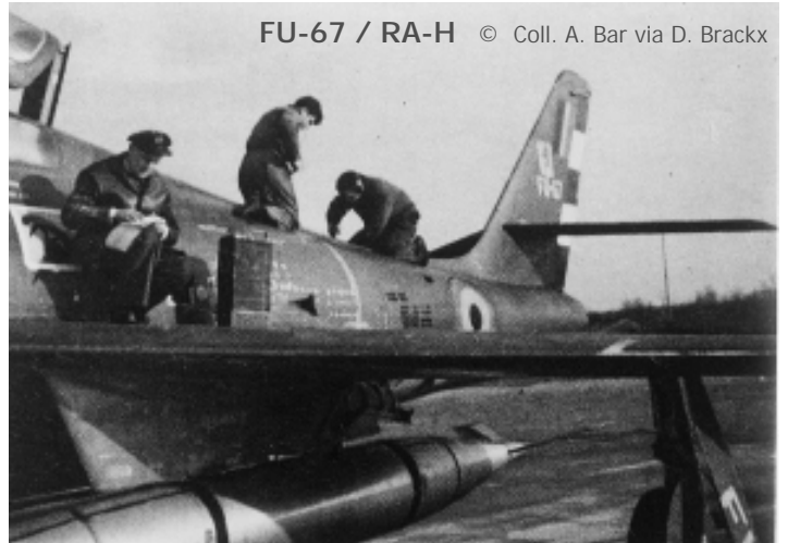
FU-67 / RA-H