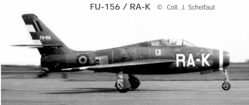
FU-156 / RA-K