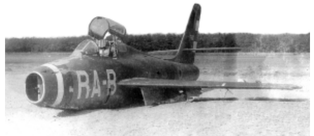
FU-107 / RA-B