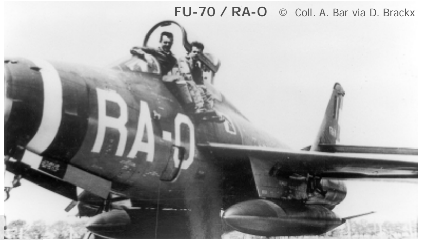
FU-70 / RA-O